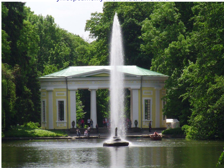
Національний дендрологічний парк «Софіївка»